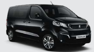
Μαύρο Perla Nera (2)