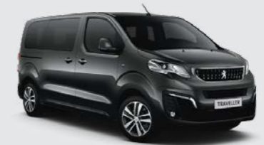
Γκρι Platinum (2)