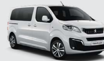
Λευκό Banquise (1)

Επιλέξτε μία απόχρωση από τα 4 χρώματα, παστέλ ή μεταλλικά.