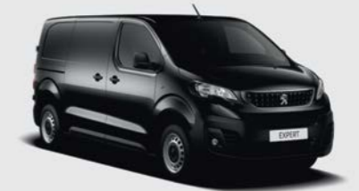
Μαύρο Perla Nera (2)