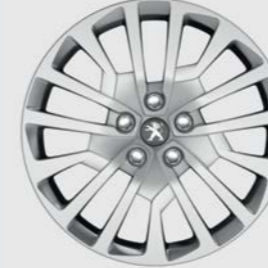
Τάσι MIAMI 17"