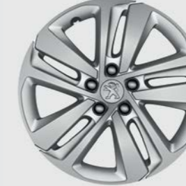
Ζάντα PHOENIX 17" (σε ματ επίστρωση)*