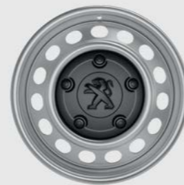
Μαύρο ή γκρι καπάκι 16" και 17"