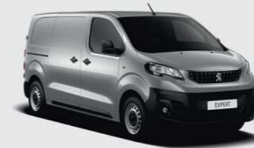
Γκρι Artense (2)