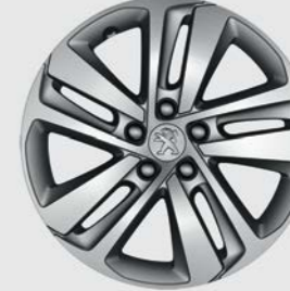
Ζάντα PHOENIX 17"

* Στον βασικό ή τον προαιρετικό εξοπλισμό, ή μη διαθέσιμο ανάλογα με την έκδοση.