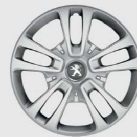
Τάσι SAN FRANCISCO 16"