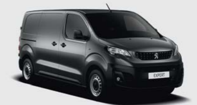
Γκρι Platinum (2)