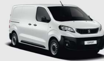
Λευκό Bonquise (1)