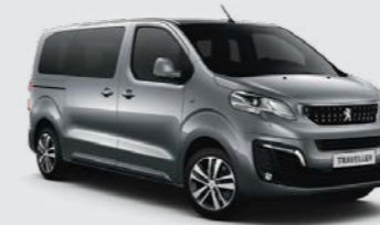
Γκρι Artense (2)