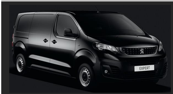
Noir Perla Nera (M) 9VMO