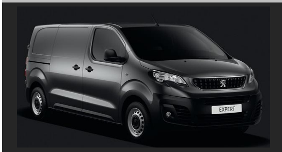
Gris Platinum (M) VLMO