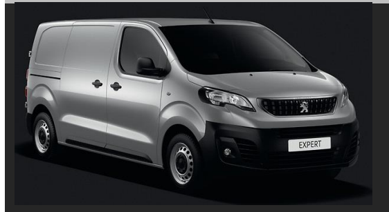
Gris Artense (M) F4MO